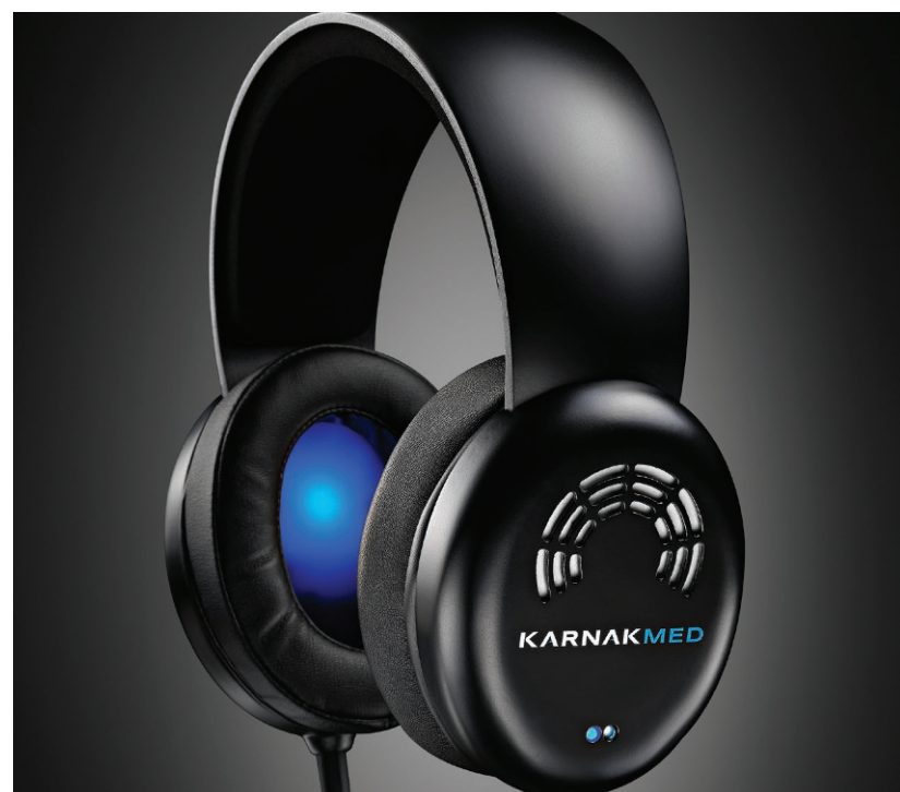
LA CUFFIA IDEATA DALL'AZIENDA PRODUCE CAMPI ELETTROMAGNETICI PULSATI (PEMF)

Il dispositivo medico è certificato per più destinazioni d'uso, come racconta l'esperto: dall'insonnia alla cefalea, dalla depressione alla terapia del dolore, fino alla fibromialgia, l'osteopo-